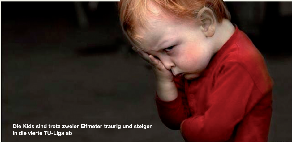
Die Kids sind trotz zweier Elfmeter traurig und steigen in die vierte TU-Liga ab