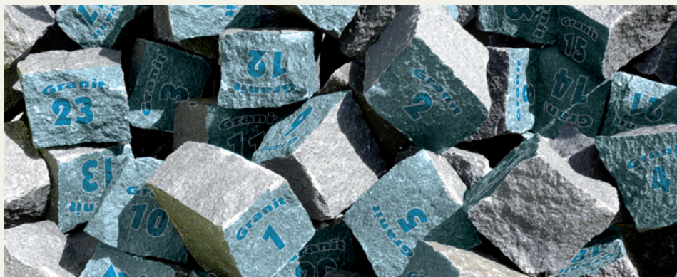
In nur einem Spiel verdoppelt Kwakkenbos fast Granits Gegentrefferbilanz und bricht deren Siegesserie

MOABIT – Kein geringerer als der Spitzenreiter stand heute als Gegner auf dem Platz. Eine furchterregende Bilanz von sieben Siegen in sieben Spielen und 34 zu 6 Toren zierte die Visitenkarte von Granit. Aber die Kwakkenbosse scherten sich nicht um solch statistische Spitzfindigkeiten und starteten wie gewohnt in die Partie. Und so verlief dann auch nach althervertem Kwakkenbos-Rezept die Anfangsphase: Man nehme elf noch völlig orientierungslose Kwakkenbosse, fünf gespielte Minuten, zwei schnell vorgetragene Angriffe des Gegners und fertig ist das 2:0 – mmmh lecker! (1:0 Weitschuss vom rechten Strafraumrand, 2:0 Direktschuss flach ins linke Eck aus zehn Metern). Doch unbeirrt vom Rückstand nahmen nun die Bosse das Zepter in die Hand, ließen den Rest der ersten Hälfte hinten nichts mehr anbrennen und wussten auch vor des Gegners Tor erste Akzente zu setzen. Mitte der ersten Hälfte ist es dann Polo, der sich 20 Meter vorm gegnerischen Strafraum durchsetzt und den Ball quer auf Dennis durchsteckt. Dieser braucht freistehend nur noch flach einzuschieben – 2:1. Im Minutentakt ergaben sich nun hochkarätige Chancen für die Bosse. Und so war es nur eine Frage der Zeit bis sich Folker gegen seinen Gegenspieler durchsetzte und einen Steilpass aus zentraler Position flach zum 2:2 im Tor unterbringen konnte. Unglücklich: Bei dieser Aktion verletzt sich ein Granitler am Näschen und kann das Spiel leider nicht fortsetzen. Halbzeit.